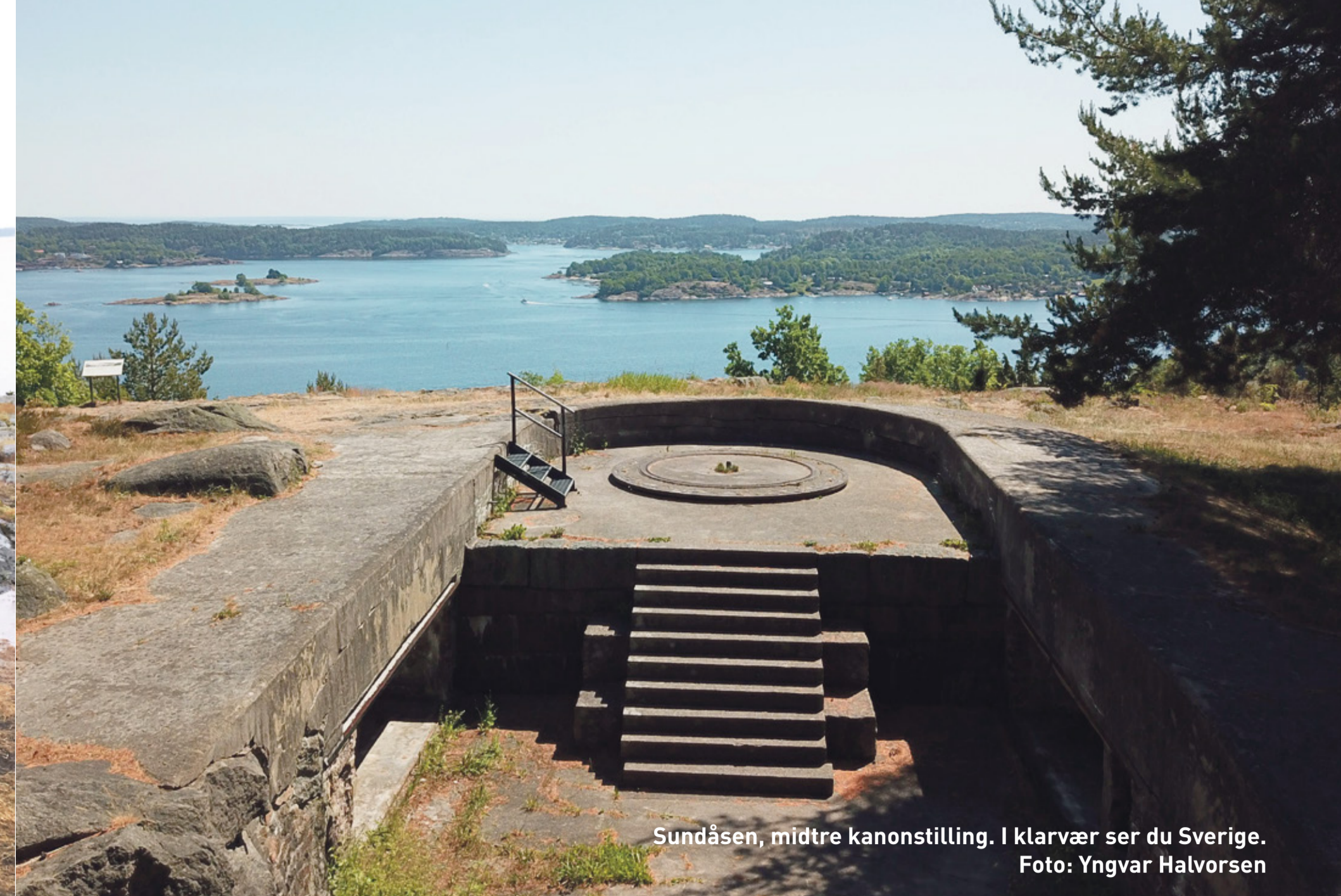
Sundåsen, midtre kanonstilling. I klarvær ser du Sverige.