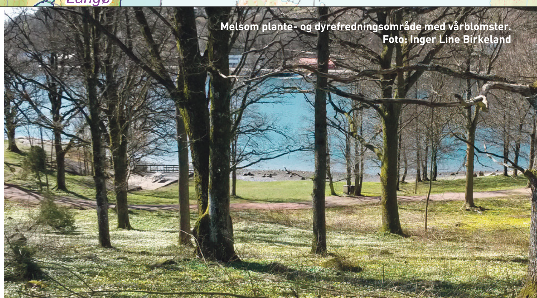
Melsom plante- og dyrefredningsområde med vårbloster.