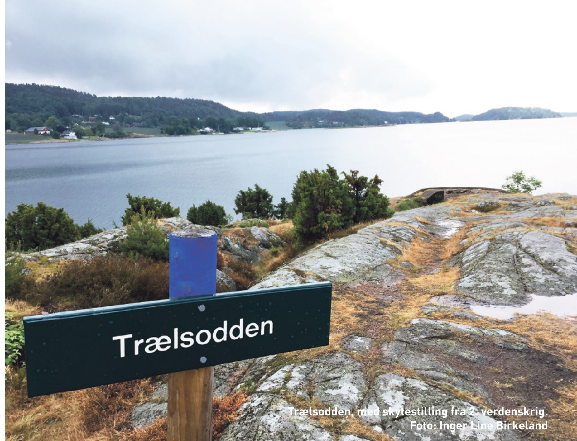
Trælsodden, med skytestilling fra 2. verdenskrig.