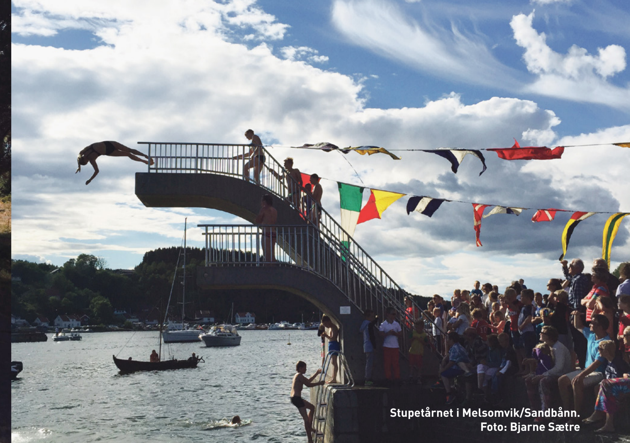
Stupetårnet i Melsomvik/Sandbånn.