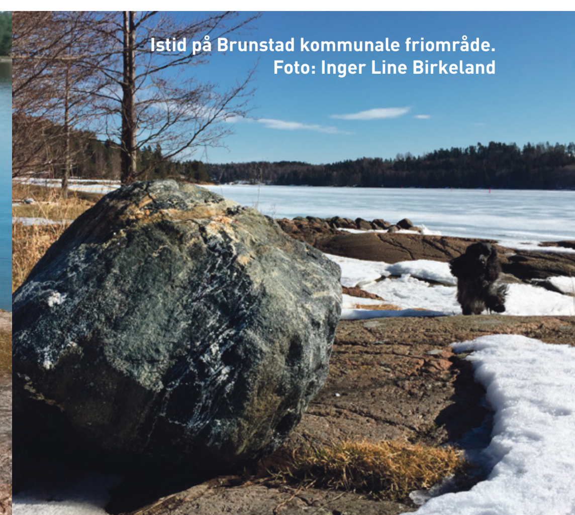
Isstid på Brunstad kommunale friområde.