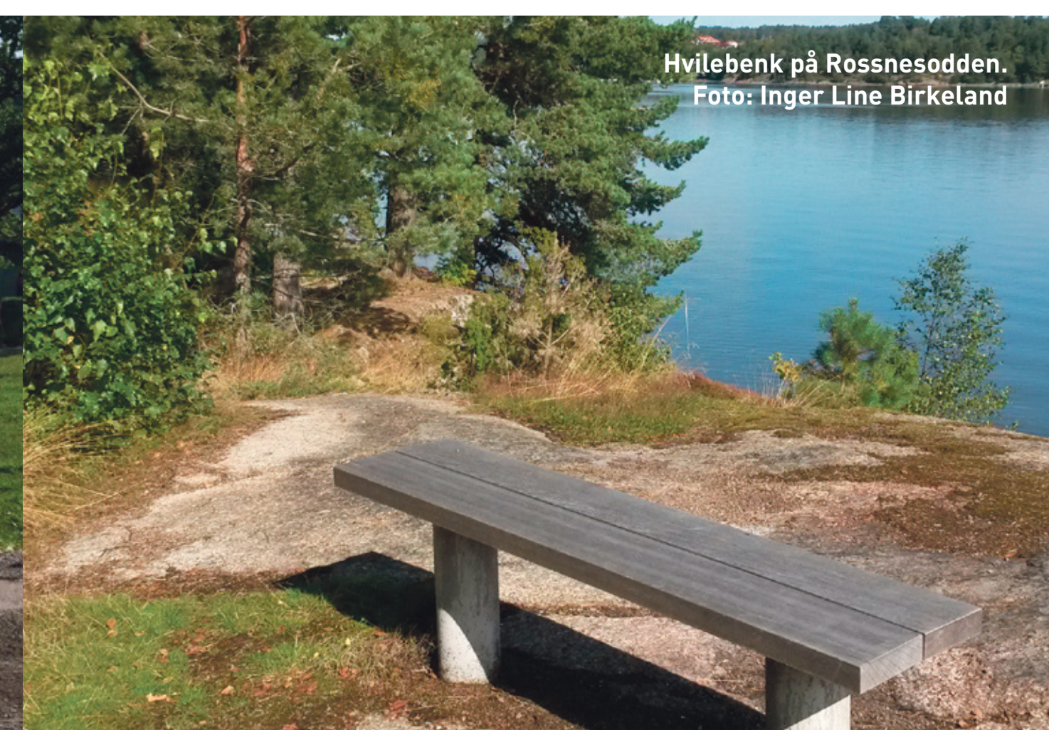
Hvilebenk på Rossnesodden.