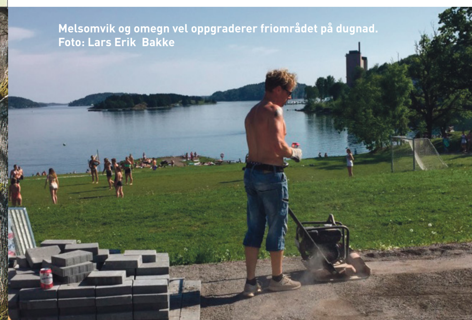
Melsomvik og omegn oppgraderer friområdet på dugnad.