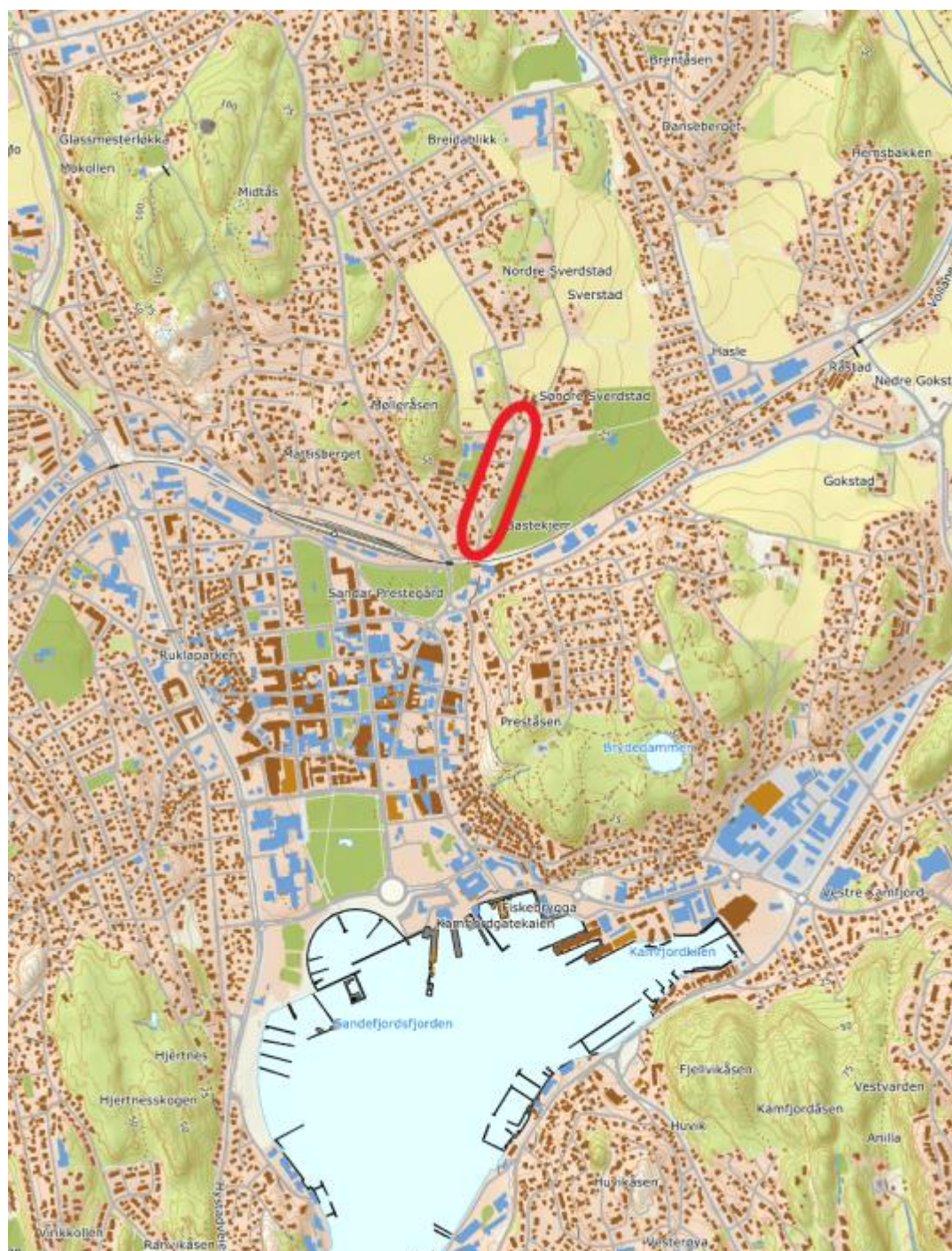
Figur 1 Oversiktskart

Planområdet ligger langs Sverdstadveien i Sandefjord kommune. Strekningen er ca. 400 meter lang.