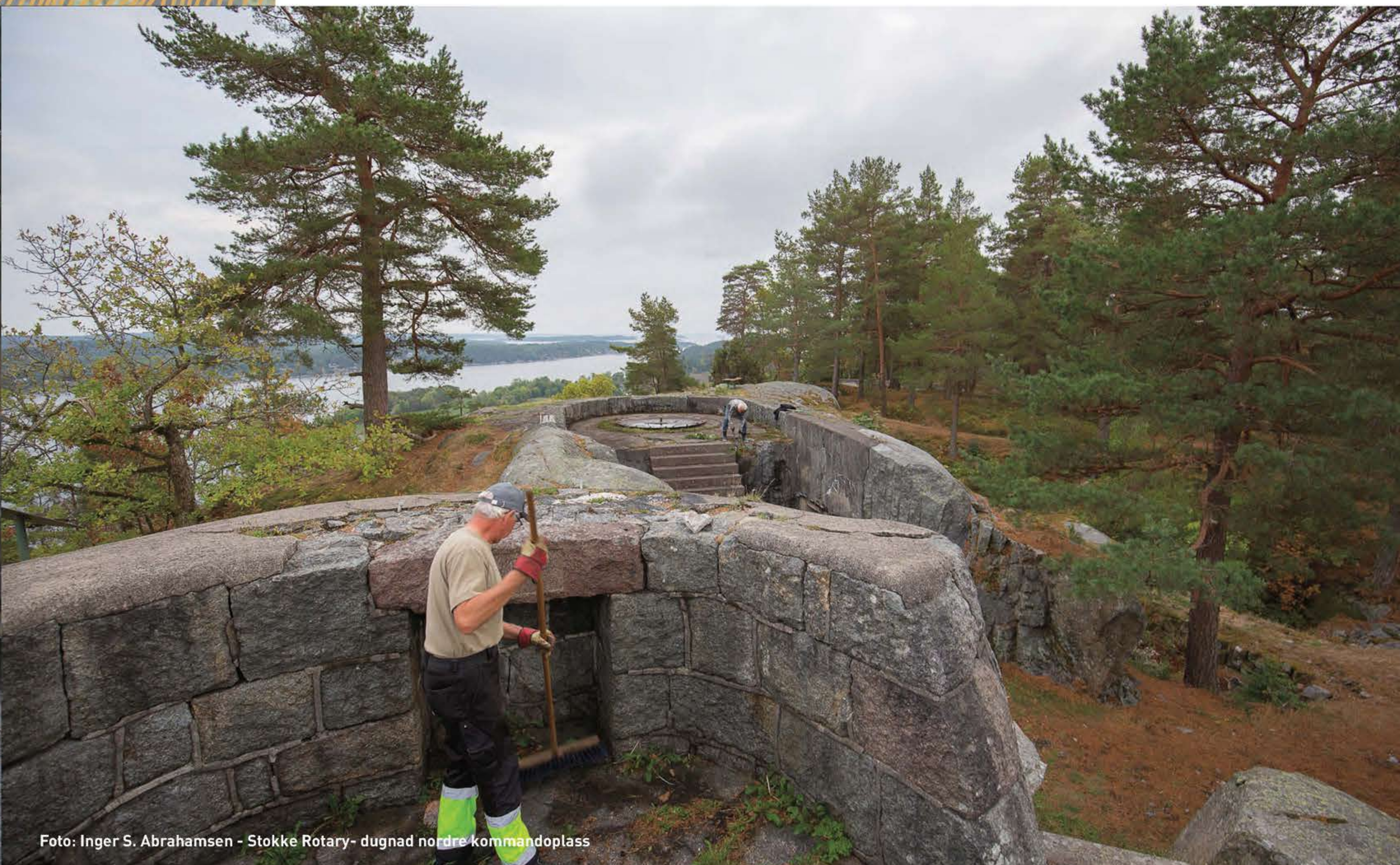
Stokke Rotary- dugnad nordre kommandoplass