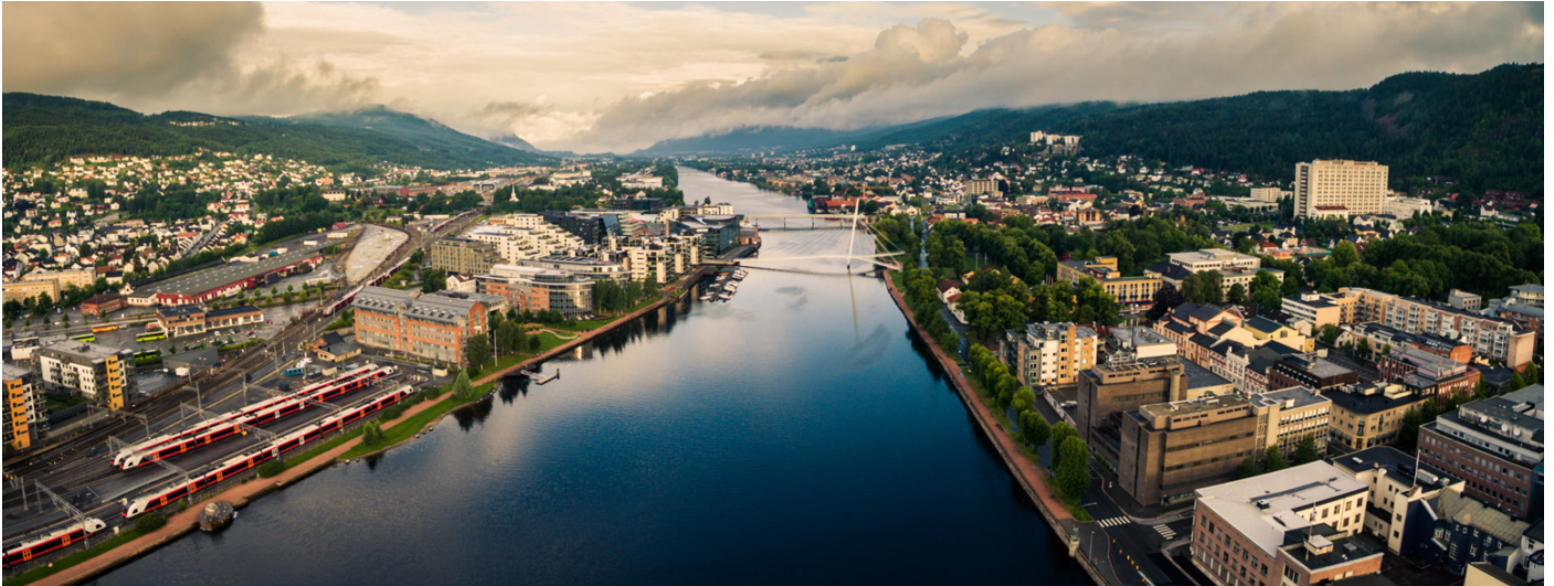
Elvepromenaden og Jernbanekaia i Drammen. Turvier på begge sider av Drammenselva