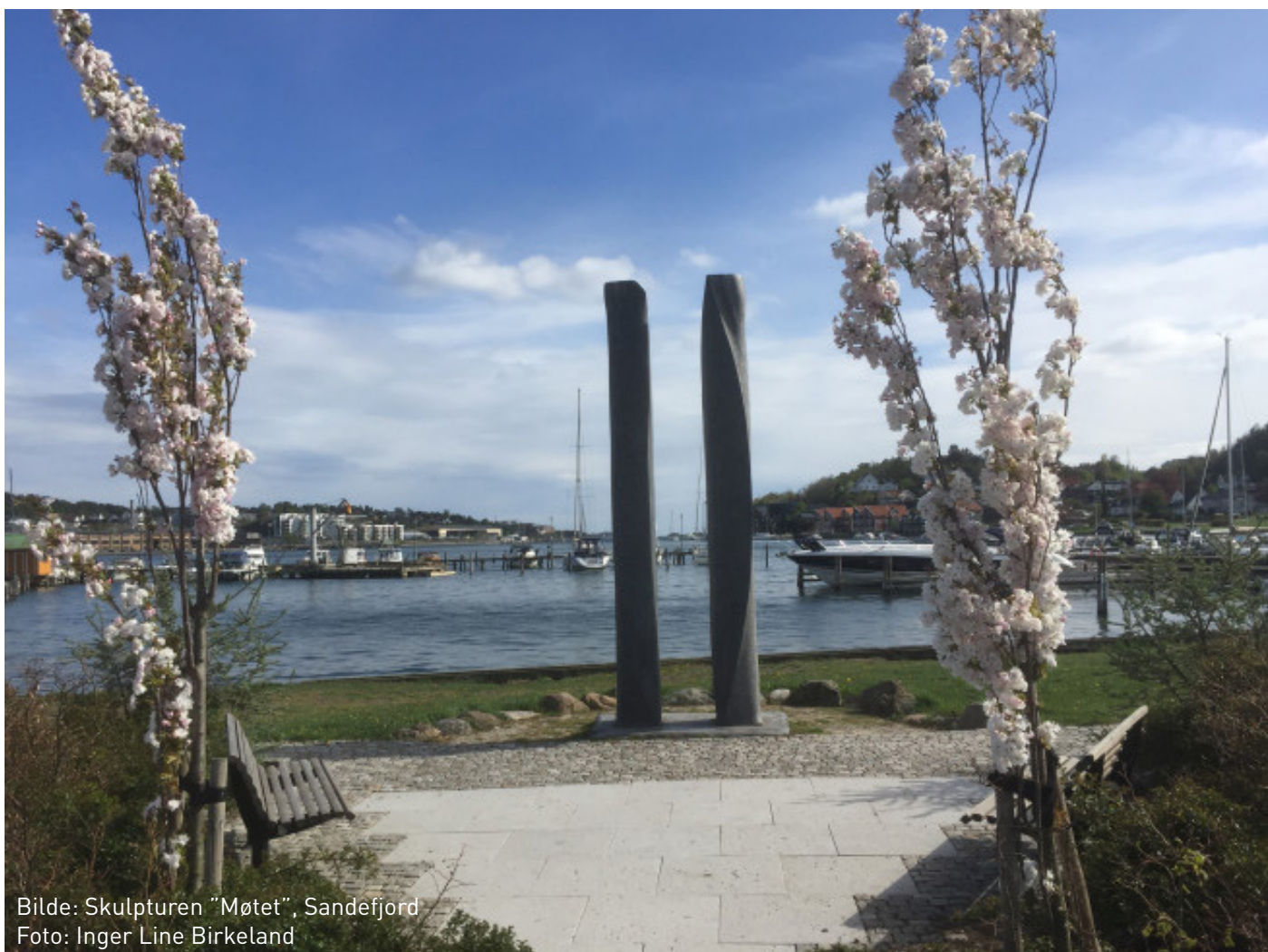
Bilde: Skulpturen "Møtet", Sandefjord