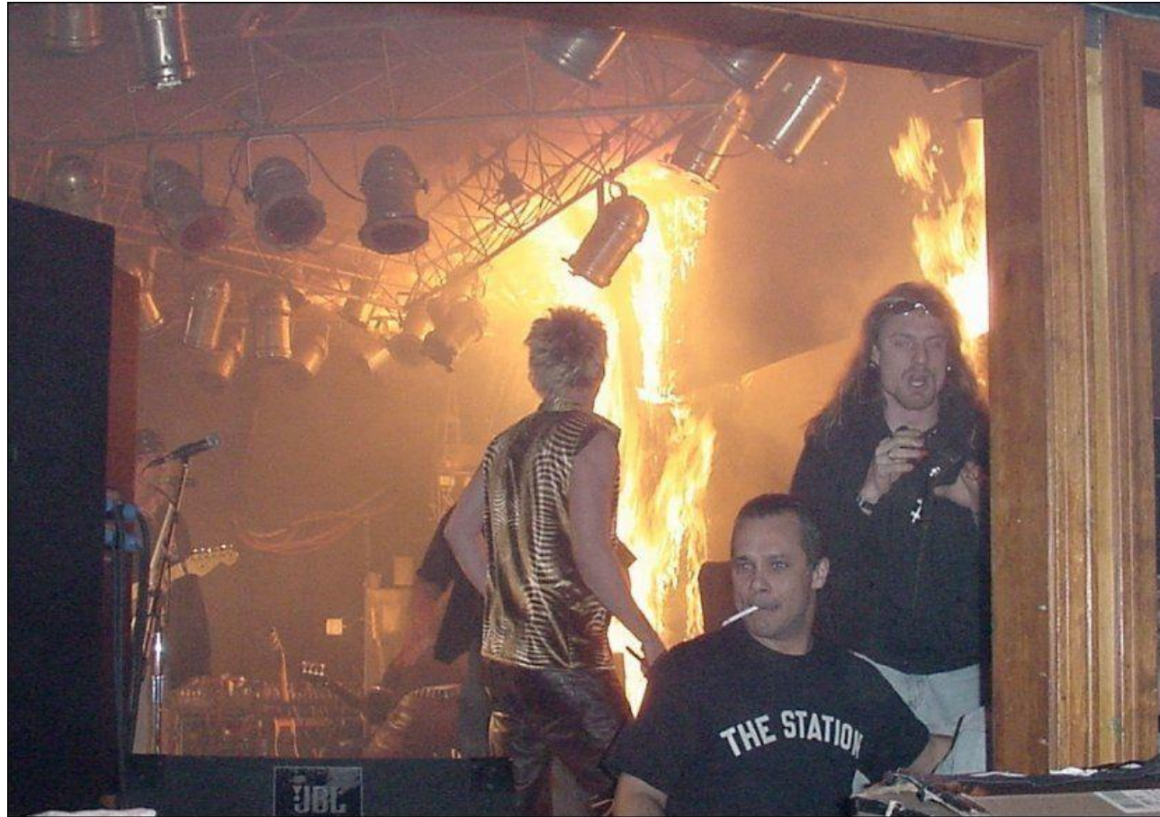
The Station Nightclub fire, 20. februar 2003